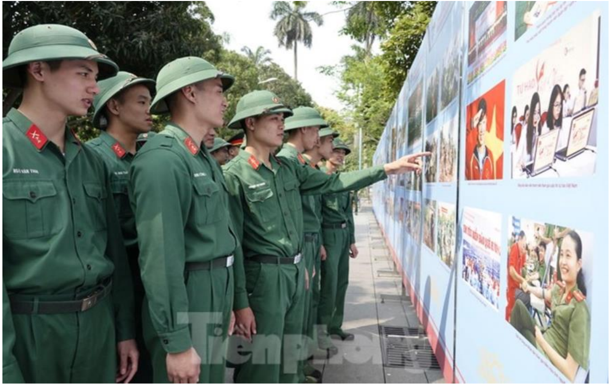
Đoàn viên Bộ tư lệnh Bảo vệ Lăng tham quan triển lãm ảnh với chủ đề “Bác Hồ với thanh niên”.

Kế tục truyền thống và sự nghiệp cha anh, thanh niên Việt Nam ngày nay mang trên vai trọng trách lịch sử phải trở thành lực lượng lao động có trí tuệ, có tay nghề cao, có đạo đức và lối sống trong sáng, có sức khỏe thể chất và sức khỏe tâm thần cường tráng để đưa Việt Nam “sánh vai với các cường quốc năm châu” như mong muốn của Bác Hồ lúc sinh thời.