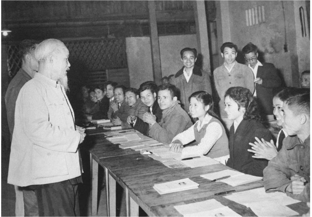
Chủ tịch Hồ Chí Minh thăm lớp học bổ túc văn hóa và kỹ thuật buổi tối của công nhân Nhà máy ô tô “1-5”, lá cờ đầu của phong trào bổ túc văn hóa ngành Công nghiệp Hà Nội (19-12-1963).